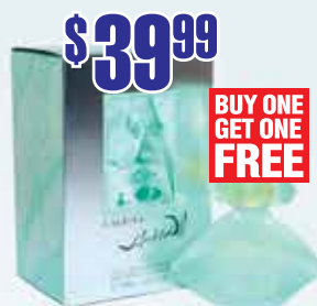
Salvador Dali Laguna