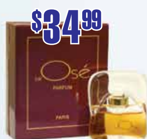
Духи J'ai Ose