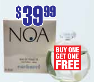
Туалетная вода Cacharel Noa