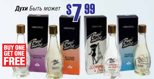
Духи Былъ MoxeT