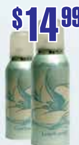
Дезодорант Anais Anais