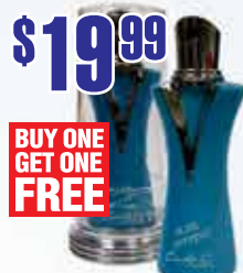
Cindy Crawford Blue Fitting