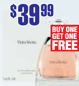
Vera Wang Woman