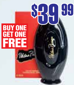
Духи Paloma Picasso