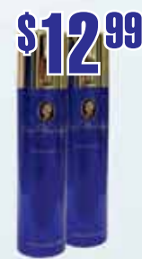
Дезодорант Pani Walewska