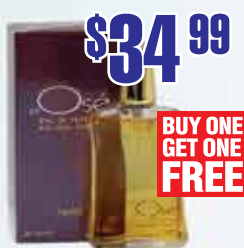
Туалетные духи J'ai Ose