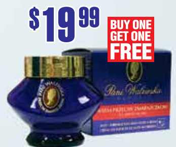
Ночной крем Pani Walewska

Art of Perfume 11703 Bustleton Avenue Philadelphia, PA 19116