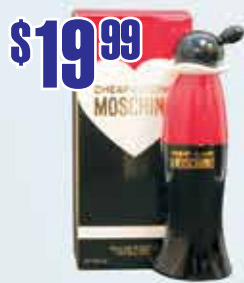
Moschino Cheap and Chic