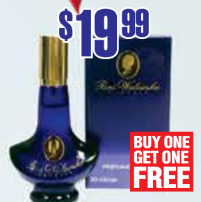
Духи Pani Walewska