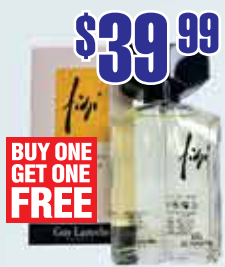
Туалетная вода Fidji