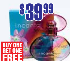
Salvatore Ferragamo Incanto Shine