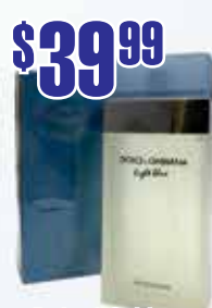
Dolce & Gabbana Light Blue