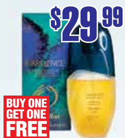
Туалетные духи Turbulences