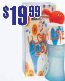
Moschino I Love Love