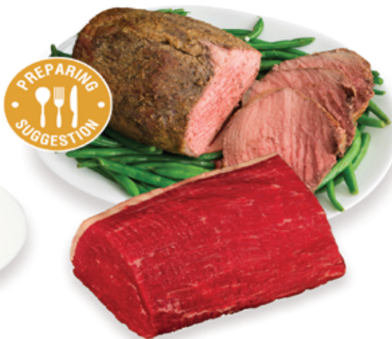
Eye of Beef Round Roast

LIMIT 10 LBS PER CUSTOMER while supplies last