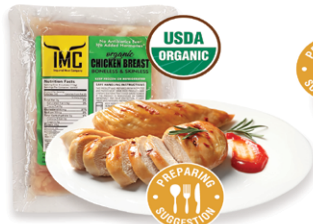
Organic Chicken Breast Boneless & Skinless LIMIT 10 LBS PER CUSTOMER while supplies last