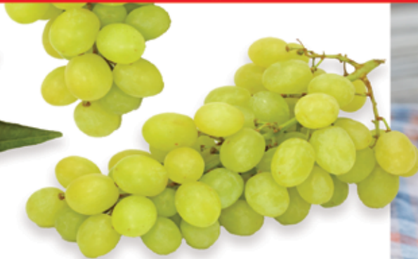
Seedless Green Grapes