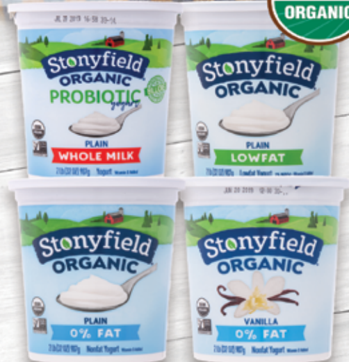
Stonyfield Organic Yogurt 32 oz Selected Varieties