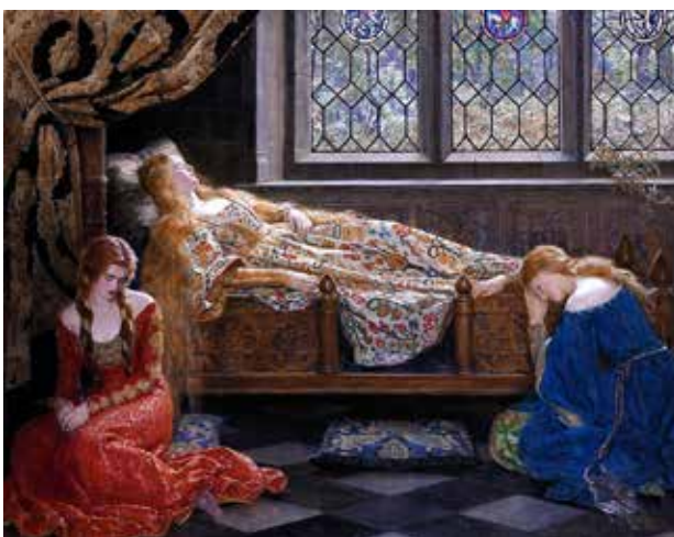
«Спящая красавица», 1921 г.

При жизни Джон Кольер был знаменит преимущественно как портретист. Среди его натурщиков были Чарльз Дарвин, тесть – профессор Хаксли и герцоги Корнуольский и Йоркский. Он восемьдесят три раза выставлял работы в Королевской академии в Лондоне и более сотни – в галерее на Саффолк-стрит, в Королевской академии Хибериан и на выставках Общества французских художников, вошел в число основателей Королевского общества художников-портретистов, писал учебники по живописи и был удостоен Ордена Британской империи в 1920 году. Всю эту славу и успех принесли ему портреты