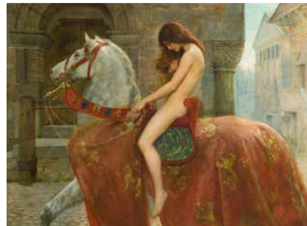
«Леди Годива», 1898 г.

представителей британского высшего света, науки и искусства.