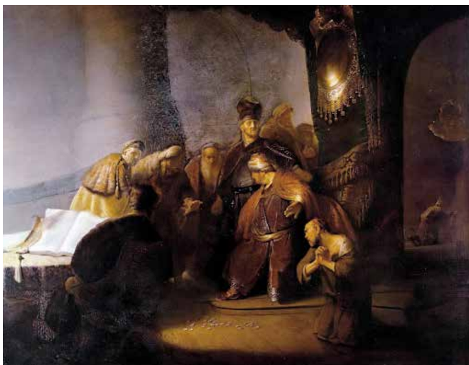
Рембрандт "Иуда возвращает тридцать сребреников"