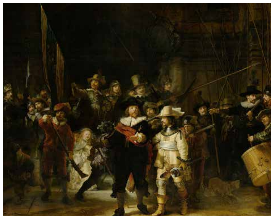
Рембрандт "Ночной дозор"