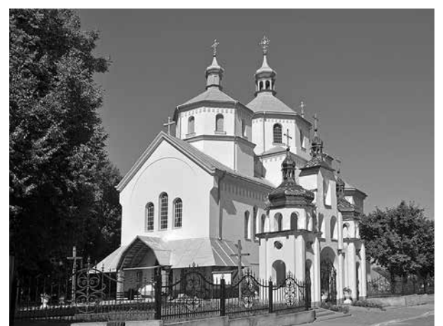
Церква Святого Миколая, Буськ.