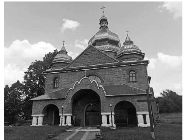
Ісаївський мурований храм