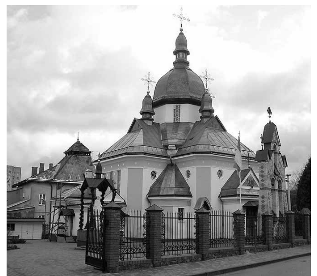
Церква святого Андрія, Клепарів.