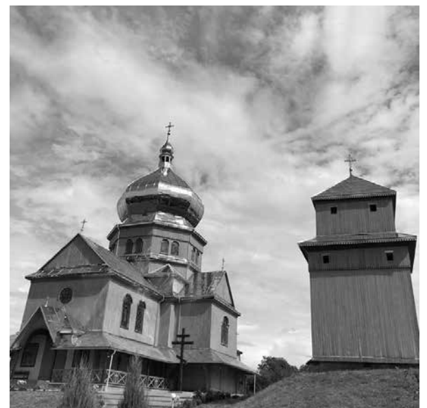
Церква Преображення Господнього ПЦУ (1939 р.) з дзвіницею села Вирів.