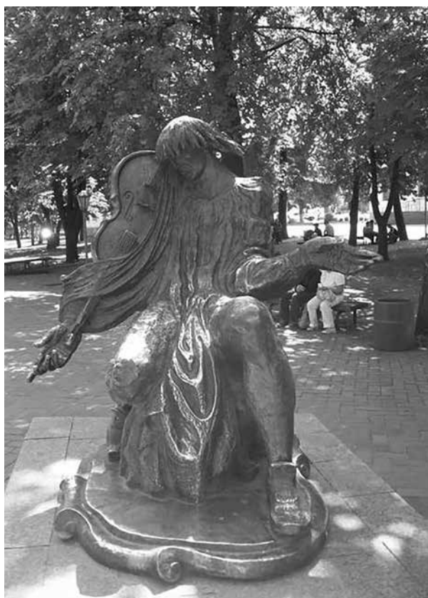
Пам'ятник Березовському у Глухові