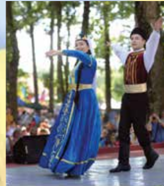
EFSANE CRIMEAN TATAR ENSEMBLE