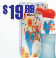
$19.99 Moschino I Love Love