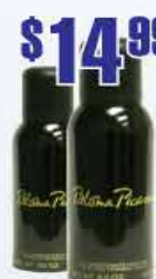
$14.99 Дезодорант Paloma