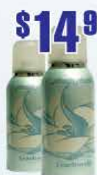
$14.99 Дезодорант Anais Anais