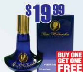
$19.99 Духи Pani Walewska