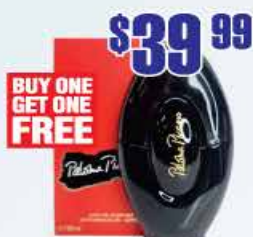
$39.99 Духи Paloma Picasso