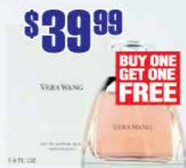
$39.99 Vera Wang Woman