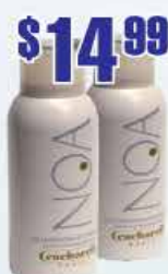
$14.99 Дезодорант NOA