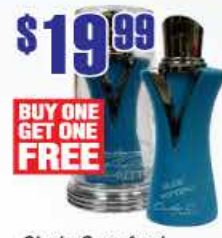
$19.99 Cindy Crawford Blue Fitting