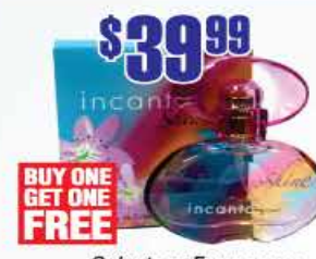
$39.99 Salvatore Ferragamo Incanto Shine