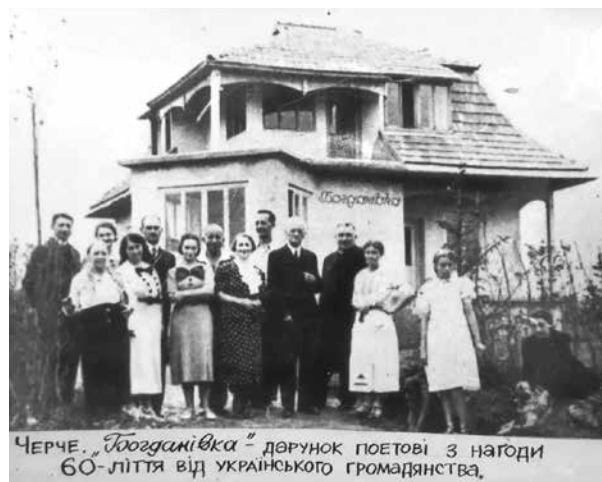
Черче. "Богданівка" дарунок поетові з нагоди 60-ліття від українського громадянства.

У 1932 році на пожертви бережанців та рогатинців була придбана для Богдана Лепкого земельна ділянка та цегла для вілли "Богданівки" у курортному селі Черче (сьогодні – Рогатинський район Івано-Франківської області). До Черча тоді їздили на воді інтелігенти, політики, різні економісти й кооператори. Приїздили сюди на сезон театр Блавацького, оперні співачки Марія Сокіл та Євгенія Зарицька. Вілла "Богданівка" стала місцем зустрічей бгеми того часу. Друга світова війна застала родину Лепких саме в цьому мальовничому куточку Батьківщини. За керівництва Андропова в 1983 р. за одну ніч віллу було знищено – як власність українського буржуазного націоналіста.