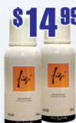
$14.99 Дезодорант Fidji