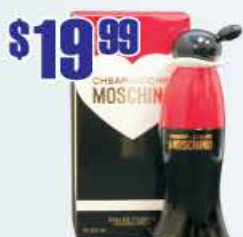
$19.99 Moschino Cheap and Chic