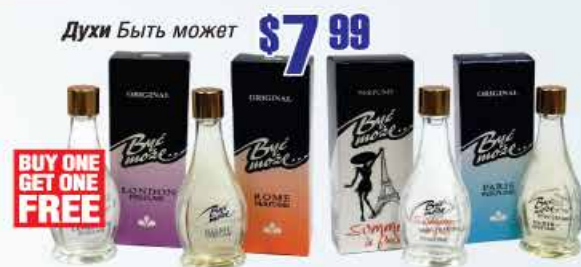
$7.99 Духи БИТЬ МОЖЕТ