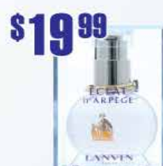
$19.99 Lanvin Eclat