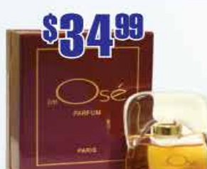
$34.99 Духи J'ai Ose