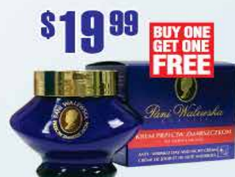
$19.99 Ночной крем Pani Walewska

Окунитесь в мир моды с давно забытыми ароматами! Более 1000 парфюмерно-косметических изделий