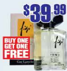
$39.99 Туалетная вода Fidji