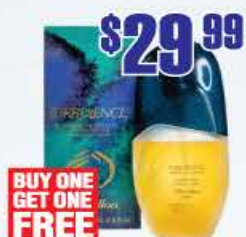
$29.99 Туалетные духи Turbulences