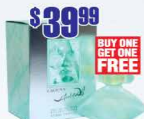
$39.99 Salvador Dali Laguna