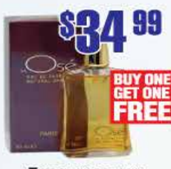
$34.99 Туалетные духи J'ai Ose