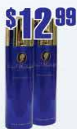
$12.99 Дезодорант Pani Walewska