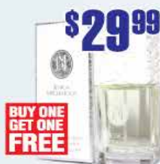
$29.99 Jessica McClintock