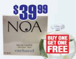
$39.99 Туалетная вода Cacharel Noa