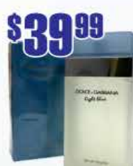
$39.99 Dolce & Gabbana Light Blue