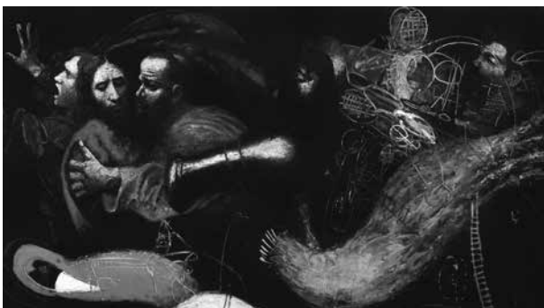
Картина художника "Прощавай, Караваджо", яку продали за рекордну суму.