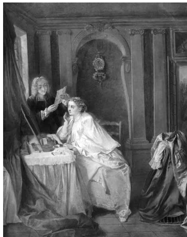
Bielidła? Czernidła? Czerwienidła? A może błękitnidła? Cóż dziś użyć, by wyglądać bosko? Obraz Nicolasa Lancreta z 1732 roku

Jan Kochanowski wyśmiewał tę przesadę, bo nie sposób było ocenić rzeczywistą urodę adorowanej damy: Równałem często jej pleć ku rumianej zarzy, A ona kramną barwę nosiła na twarzy. Co ciekawe, za