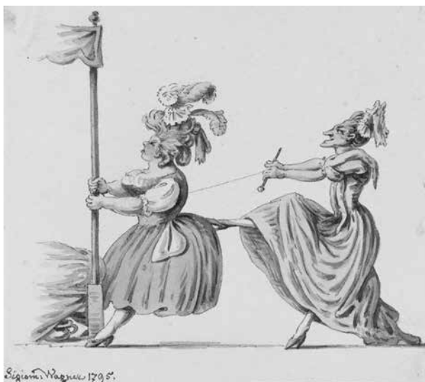
Karykatura przedstawiająca zawiązywanie gorsetu. Akwarela Zygmunta Wagnera z 1795 roku z kolekcji Szwajcarskiej Biblioteki Narodowej

Znaczenie much zależało od tego, gdzie zostały przyklejone: przy kąci oka była „rozkochana”, na policzku