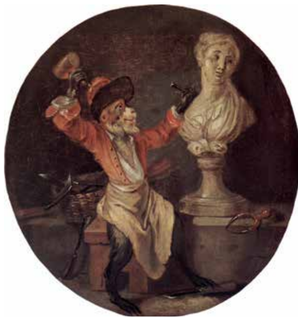
Обезьяна-скульптор, автор Антуан Ватто.

Наступил XVIII век, эпоха Просвещения, в которой концептуальная перспектива