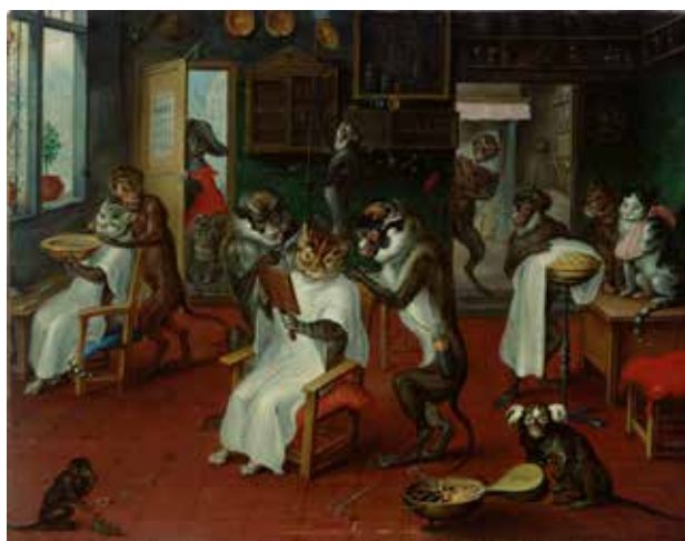
«Парикмахерская с обезьянами и кошками», автор Авраам Тенирс.