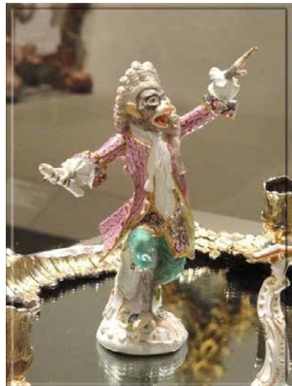
Фигурка Affenkapelle из мейсенского фарфора.

несколько изменилась. Просвещение открыло двери организованной академической науке с первой таксономией жизни, сделанной Линнеем, и примитивными попытками эволюционного объяснения, предложенными им же. Обезьяна так и осталась гротескной версией человека и, хотя и сохраняла в картинах определённый морализм, делала это в комическом тоне.