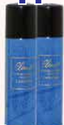
Дезодорант Climat Lancome