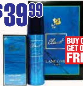
Gift Set Lancome Climat