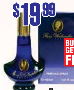
Духи Pani Walewska