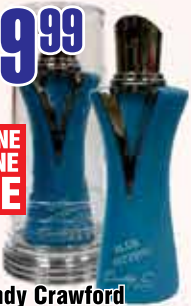
Cindy Crawford Blue Fitting