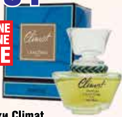
Духи Climat Lancome