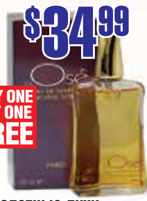
Туалетные духи Jai OSE