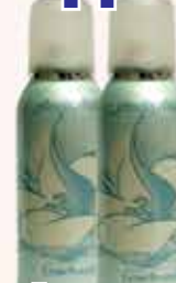
Дезодорант Anais Anais