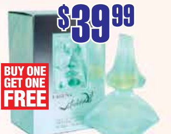
Salvador Dali Laguna