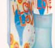
Moschino I Love Love