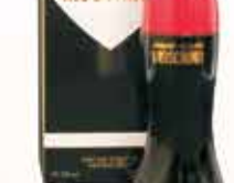
Moschino Cheap and Chic