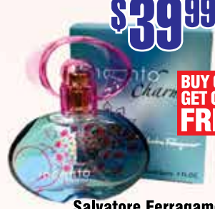
Salvatore Ferragamo Incanto Charms