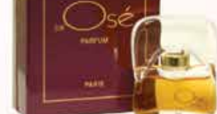
Духи Jai OSE