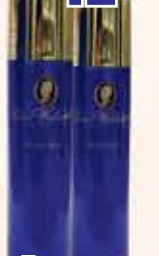
Дезодорант Pani Walewska

Производим доставку по всей территории США и Канады