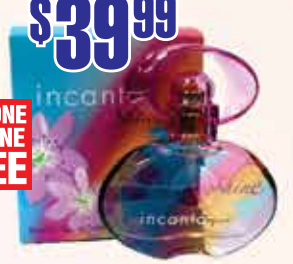
Salvatore Ferragamo Incanto Shine